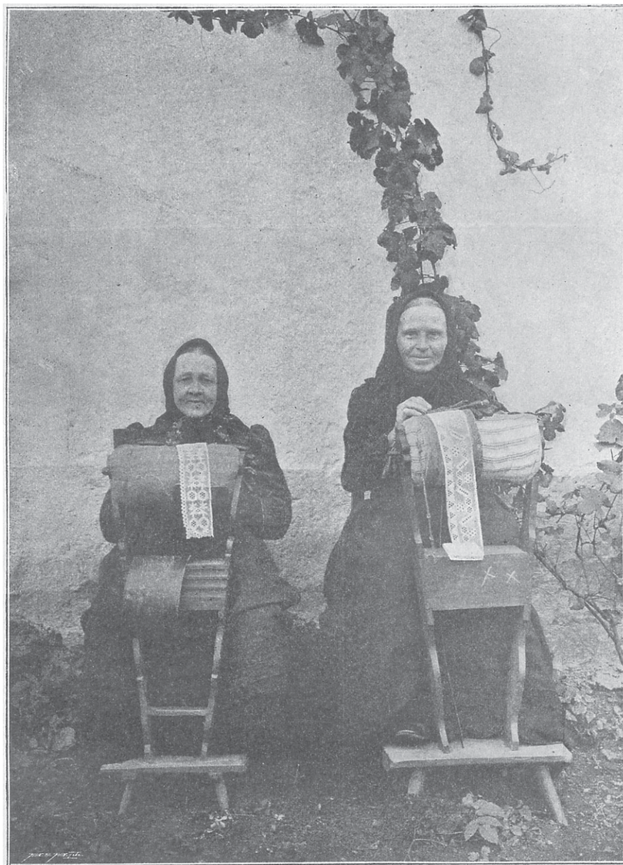
Krajčářky ze Strážova.